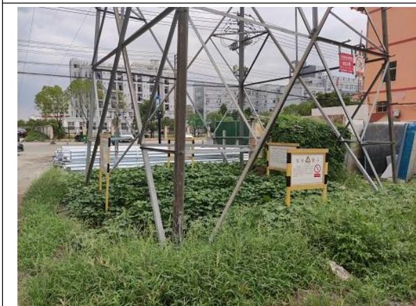
图 6-3 塔基周边环境现状