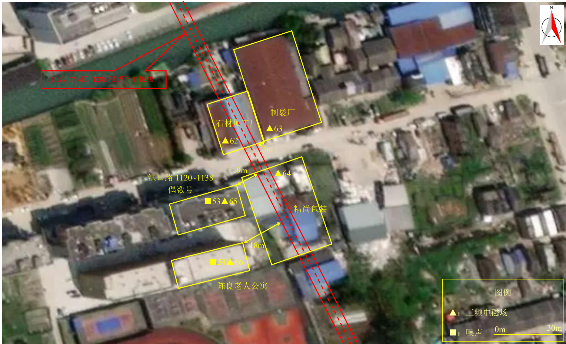
图 7-1 (12) 监测点位图