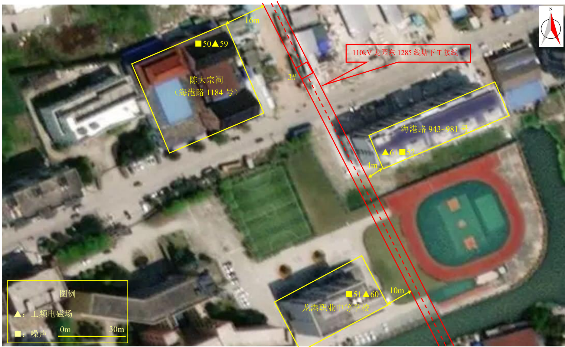
图 7-1 (11) 监测点位图