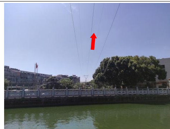
图 6-4 线路周边环境现状