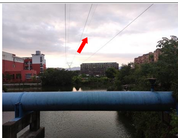
图 6-2 线路周边环境现状