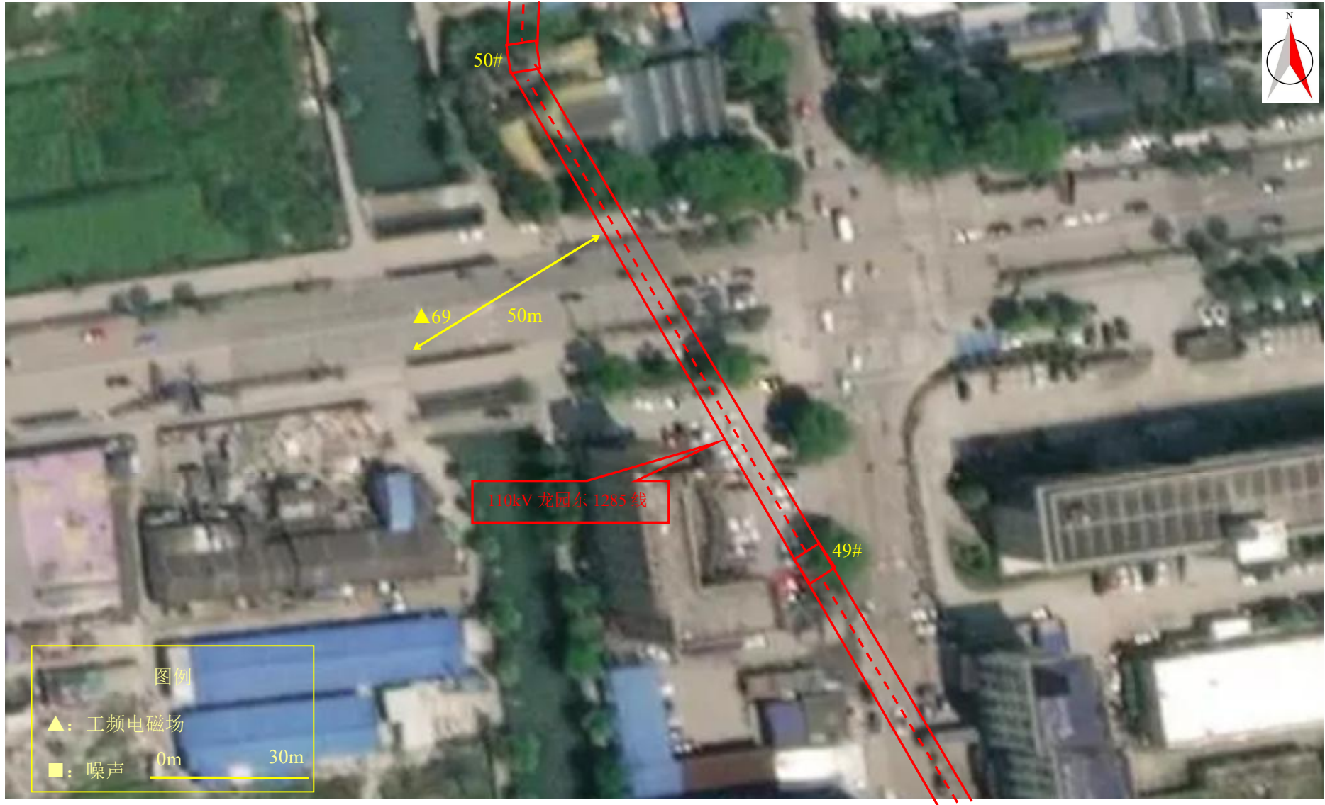
图 7-1 (15) 监测点位图