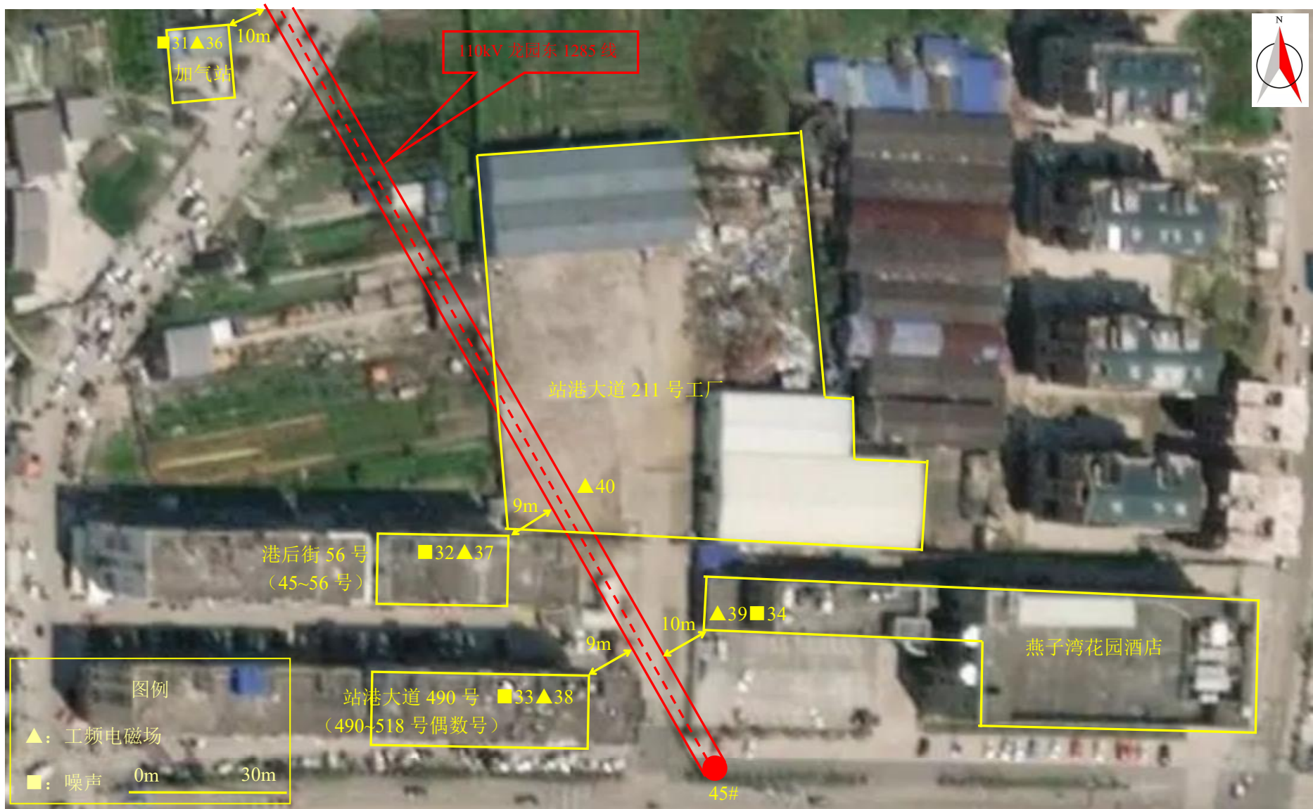
图 7-1 (7) 监测点位图