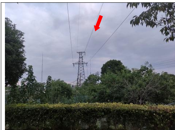
图 6-1 线路周边环境现状