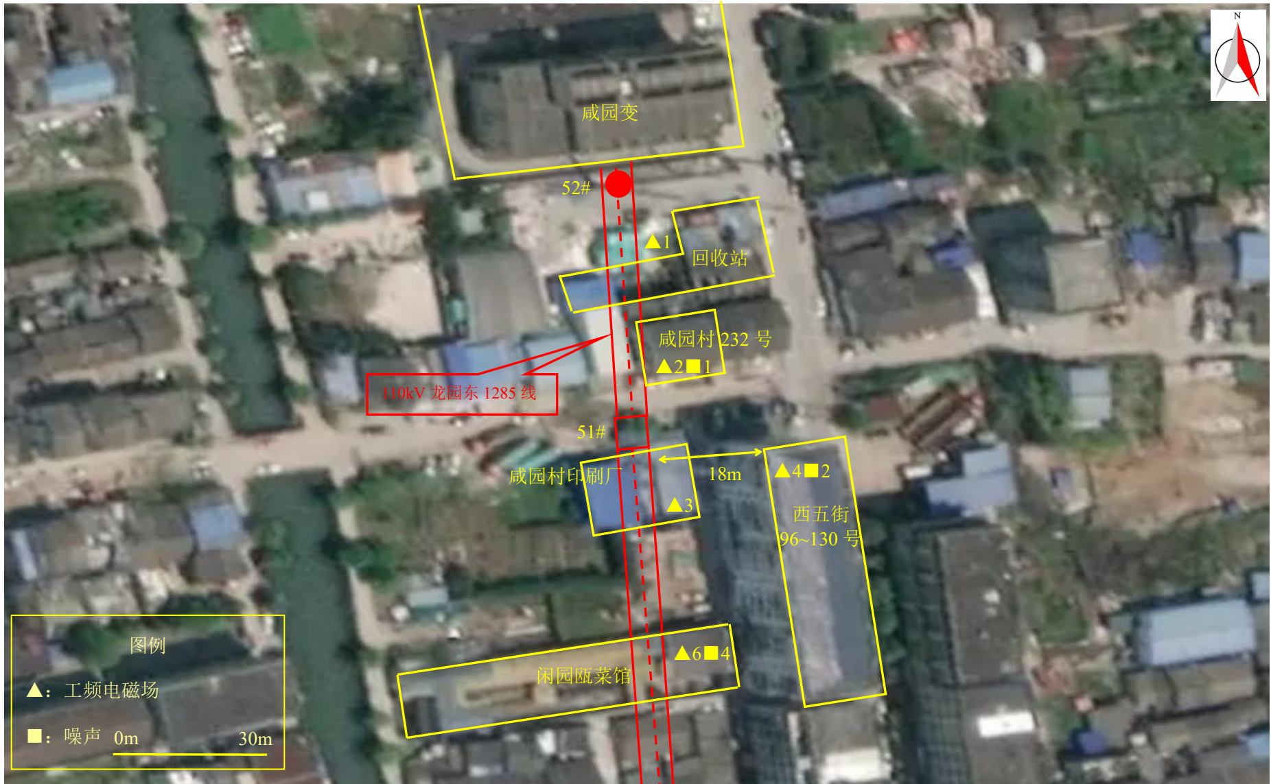
图 7-1 (1) 监测点位图