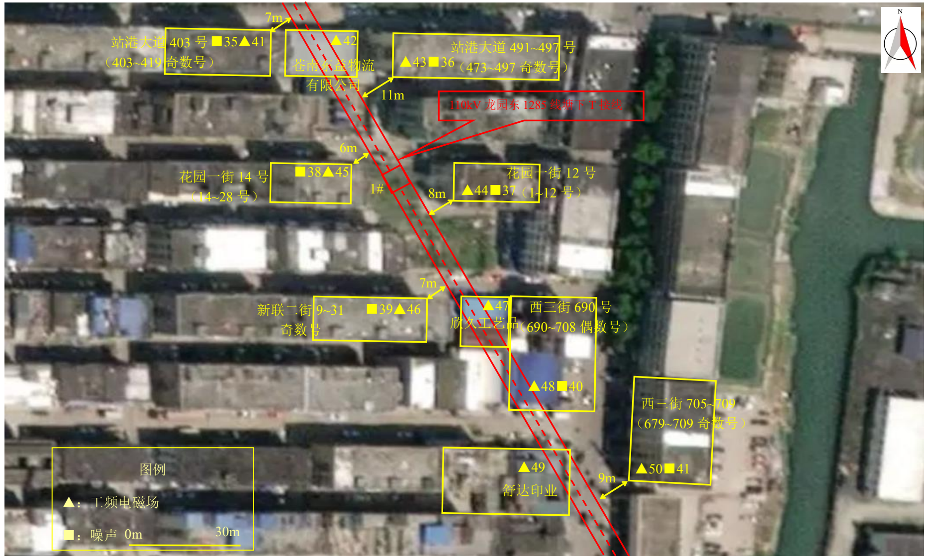
图 7-1 (8) 监测点位图