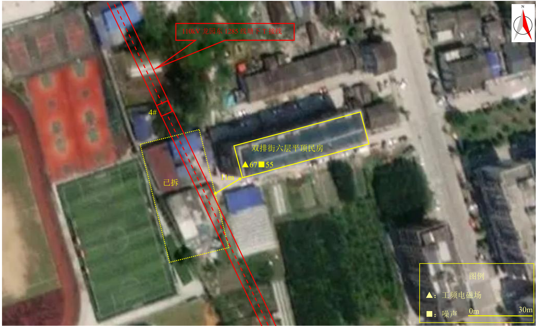
图 7-1 (13) 监测点位图