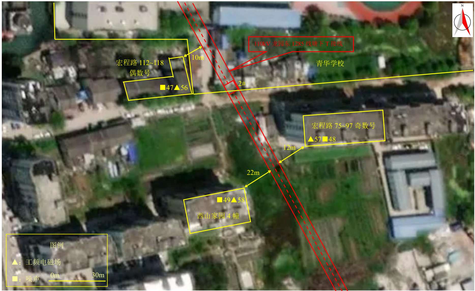
图 7-1 (10) 监测点位图