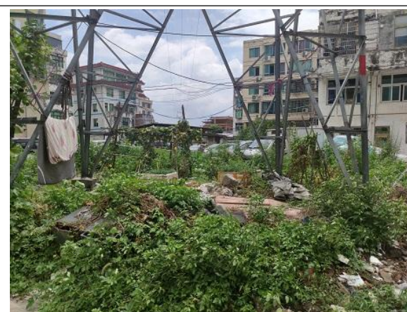
图 6-6 塔基周边环境现状