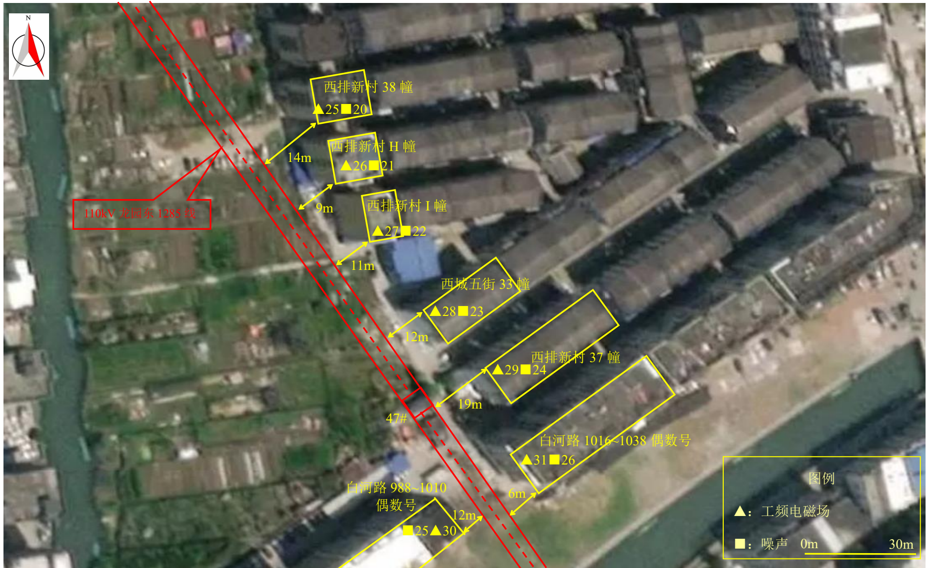
图 7-1 (5) 监测点位图