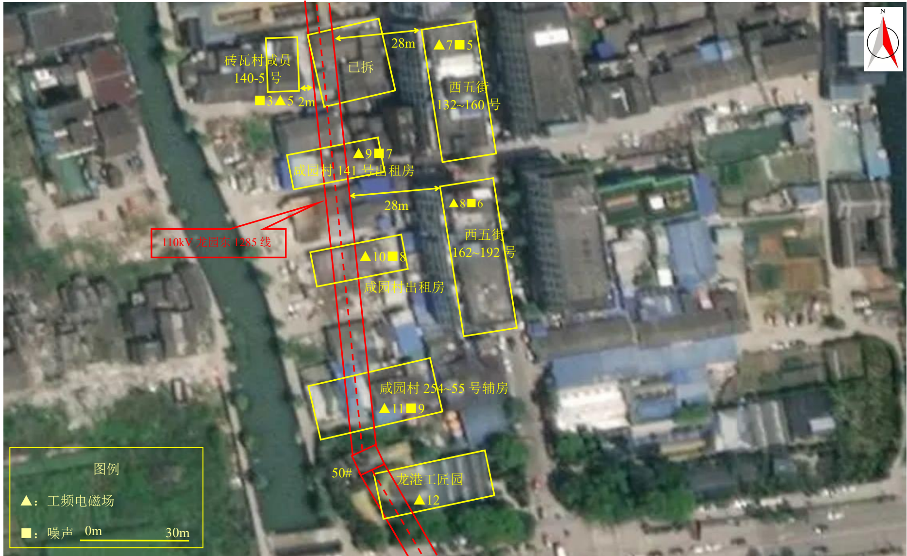
图 7-1 (2) 监测点位图