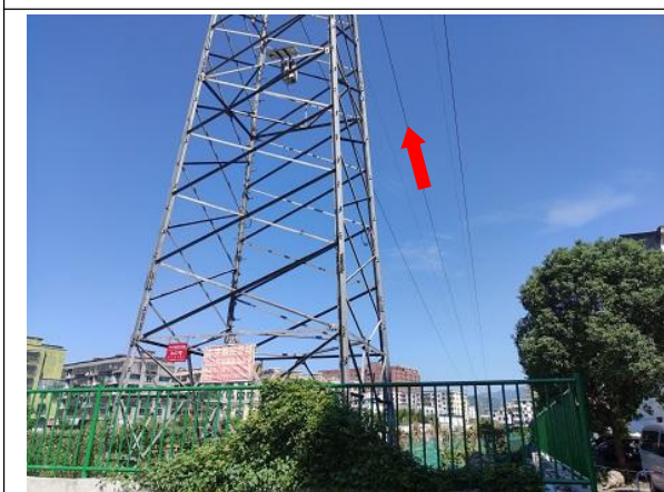
图 6-5 线路周边环境现状