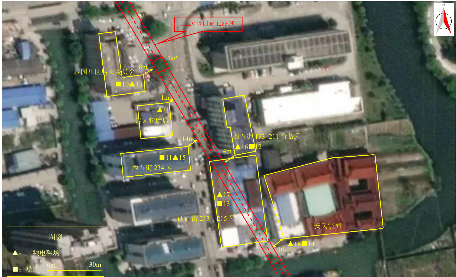
图 7-1 (3) 监测点位图