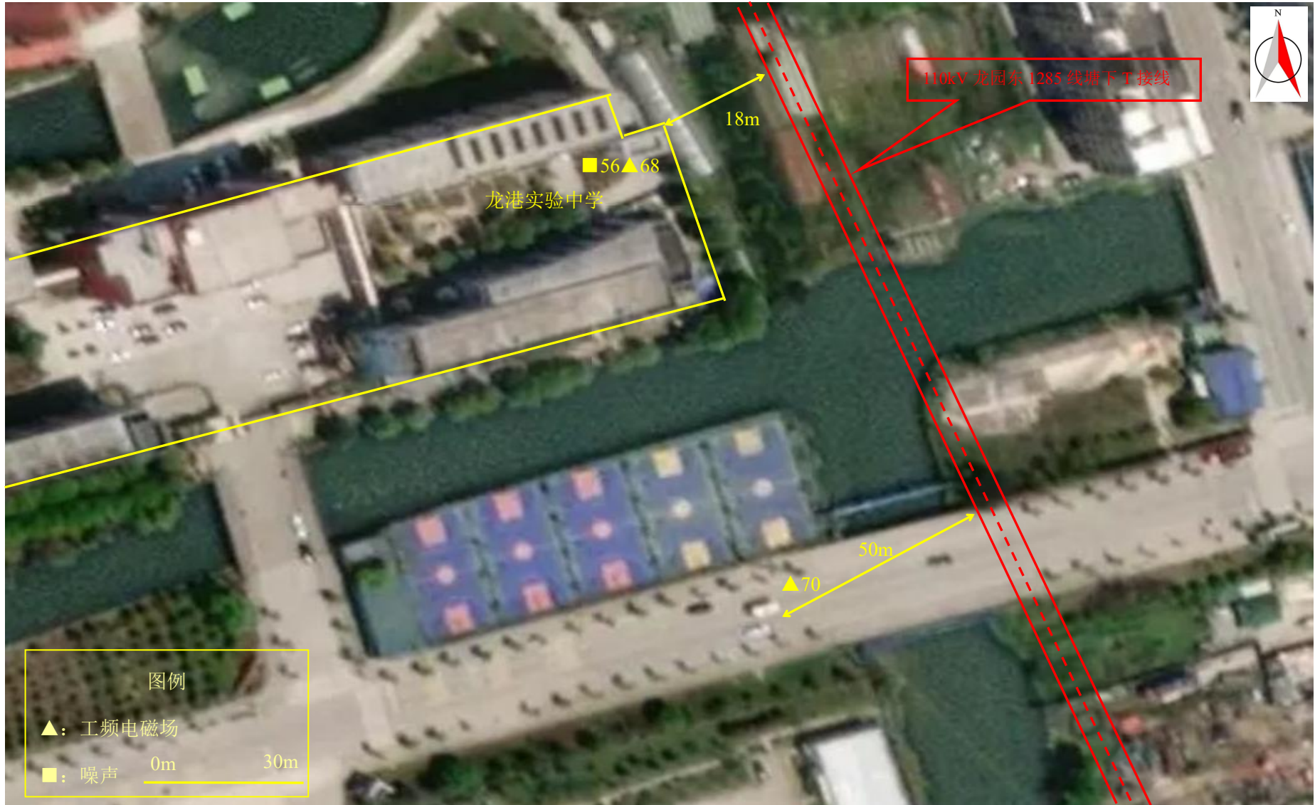
图 7-1 (14) 监测点位图