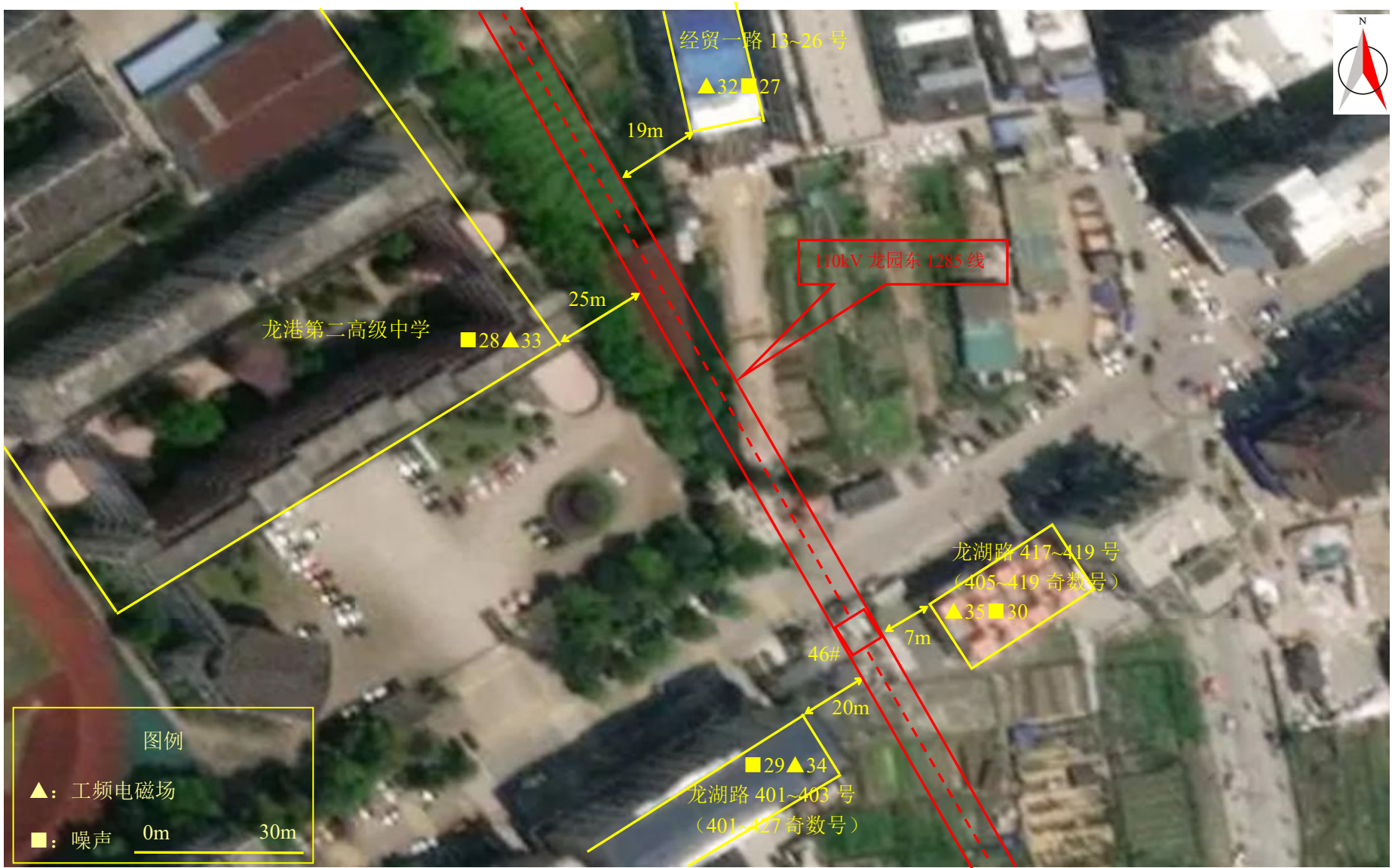
图 7-1 (6) 监测点位图