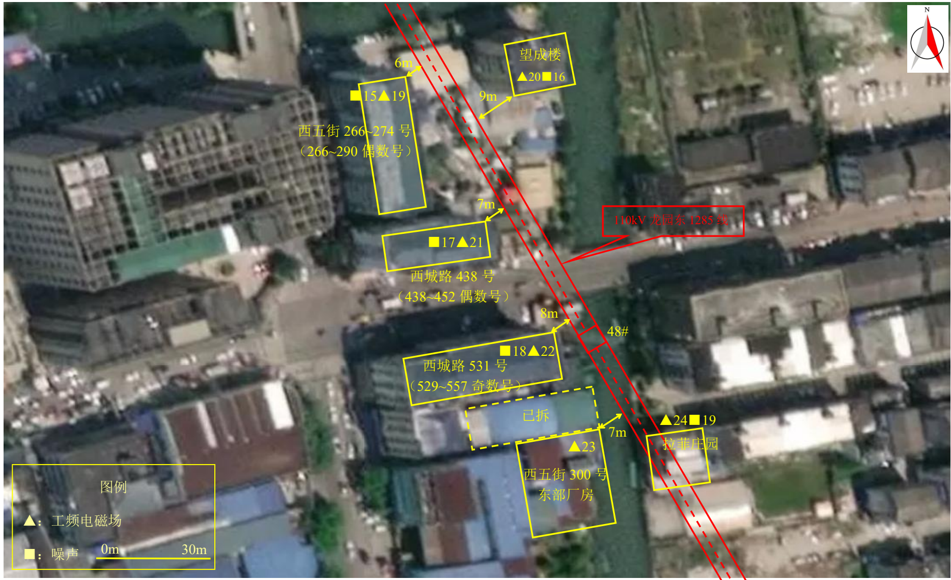
图 7-1 (4) 监测点位图