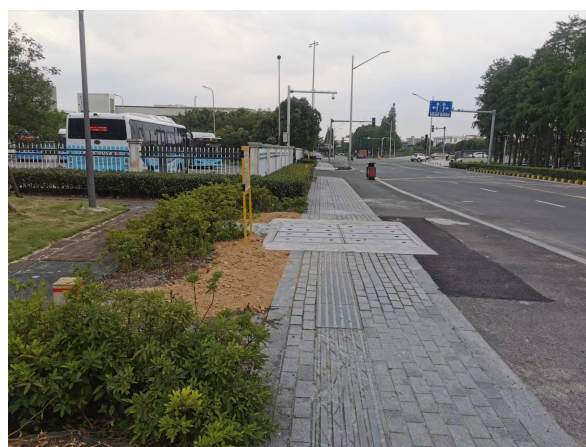
图 6-4 电缆线路周边环境现状