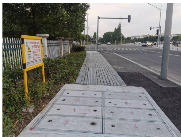
图 6-3 电缆线路周边环境现状