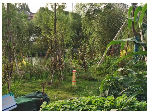
图 6-1 电缆线路周边环境现状