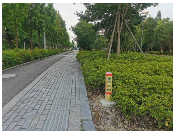
图 6-2 电缆线路周边环境现状