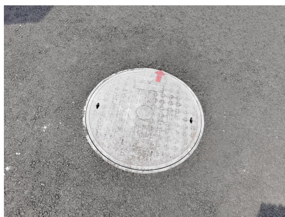
图 6-6 雨水井