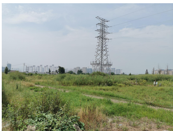
图 6-11 变电站周边环境现状（西侧）及 线路周边环境现状