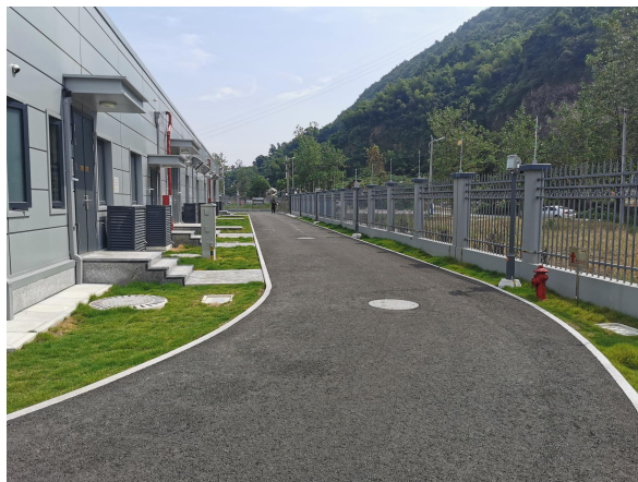
图 6-8 变电站内道路及绿化