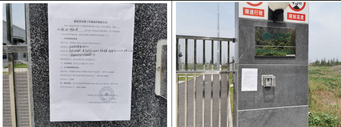
图 8-1~图 8-2 张贴在变电站门口的公示