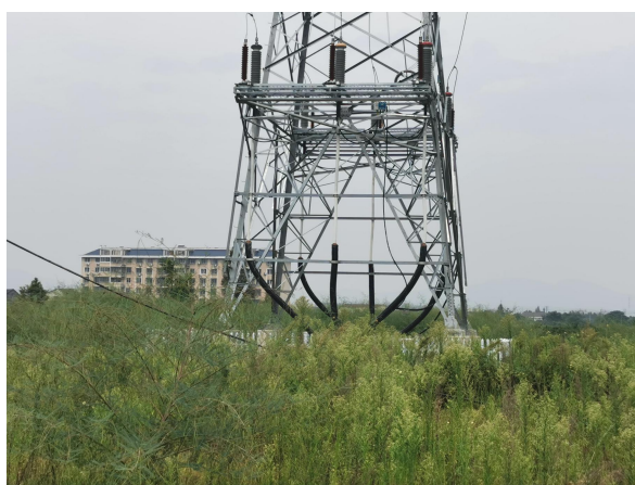
图 6-12 塔基下方植被恢复