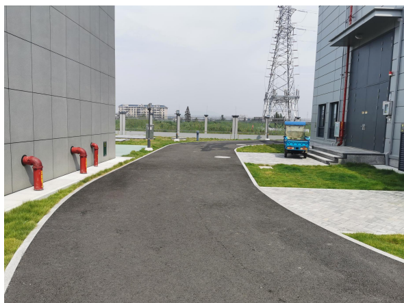
图 6-9 变电站内道路及绿化