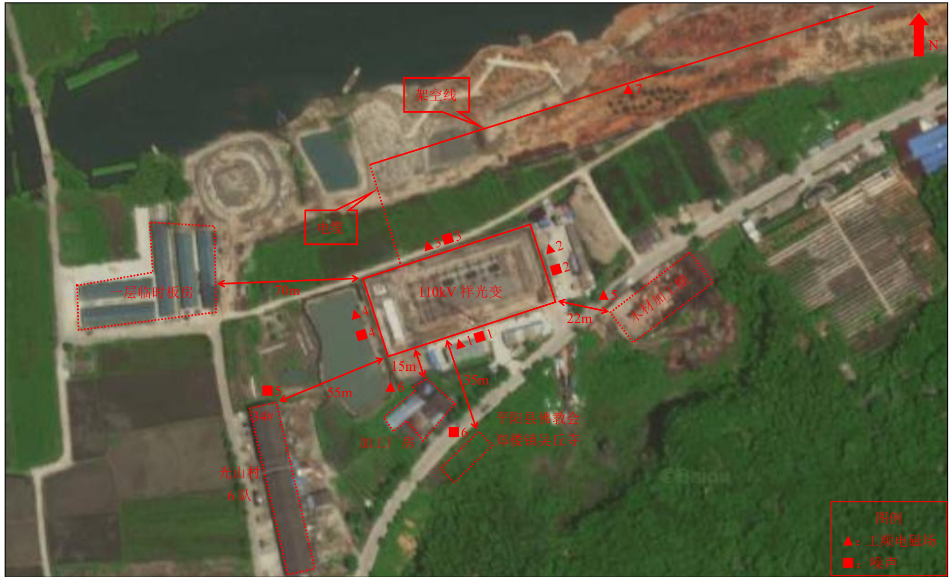
图 7-1 监测点位图