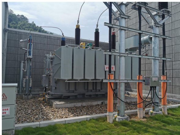
图 6-1 1#主变及下方油坑