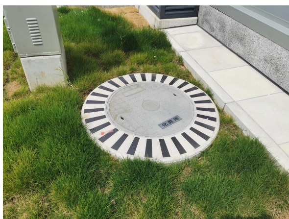
图 6-5 化粪池