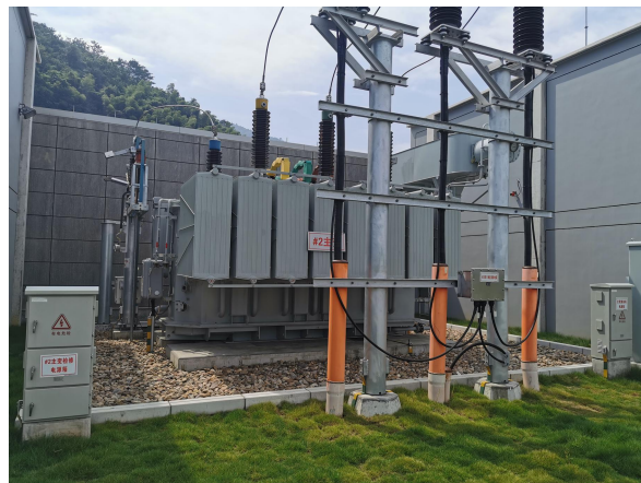
图 6-2 2#主变及下方油坑