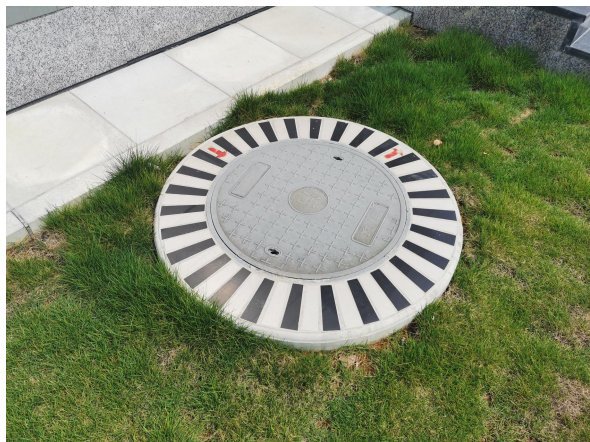
图 6-7 污水井