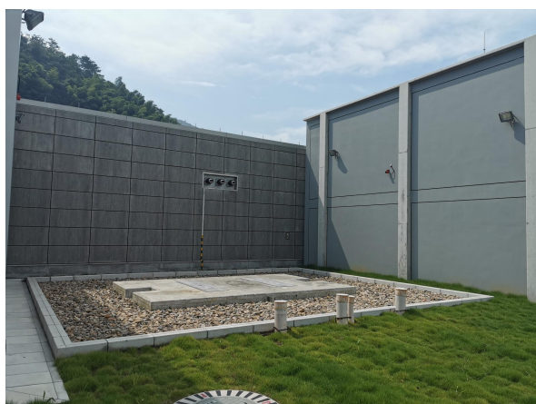
图 6-3 3#主变预留位置