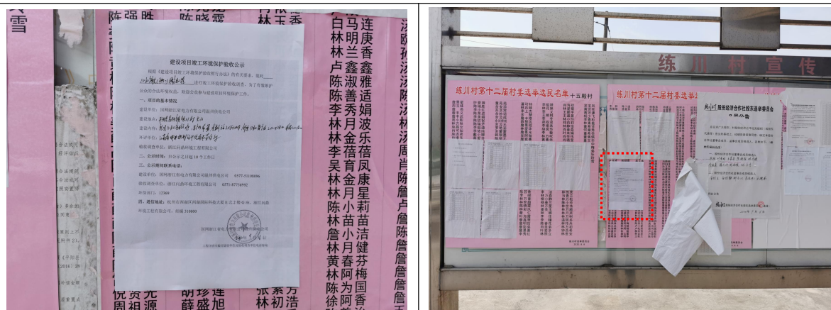
图 8-3~图 8-4 张贴在练川村村委的公示