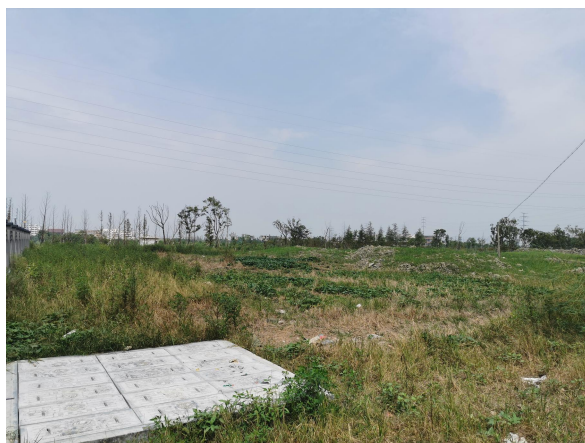
图 6-10 变电站周边环境现状（东侧）