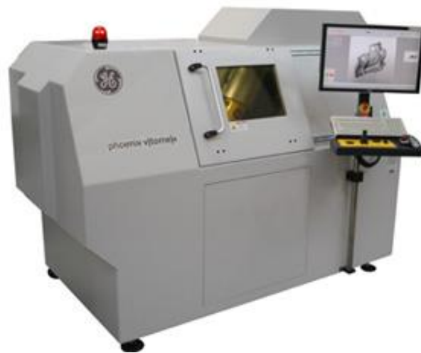
图9-1 X射线三维检测系统外观图

本项目X射线三维检测系统自带射线防护铅房，主要由X射线管、控制台、电源和操作台驱动，X射线管冷却泵和真空泵等部分组成，设备外观图见图9-1。