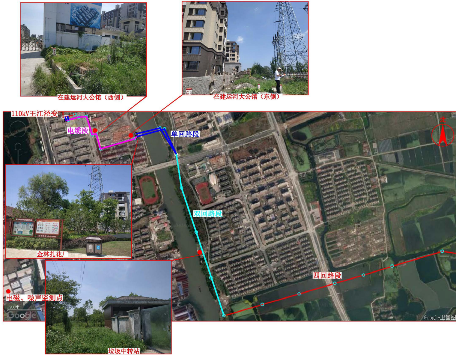
图 7-1 监测点位图（2）