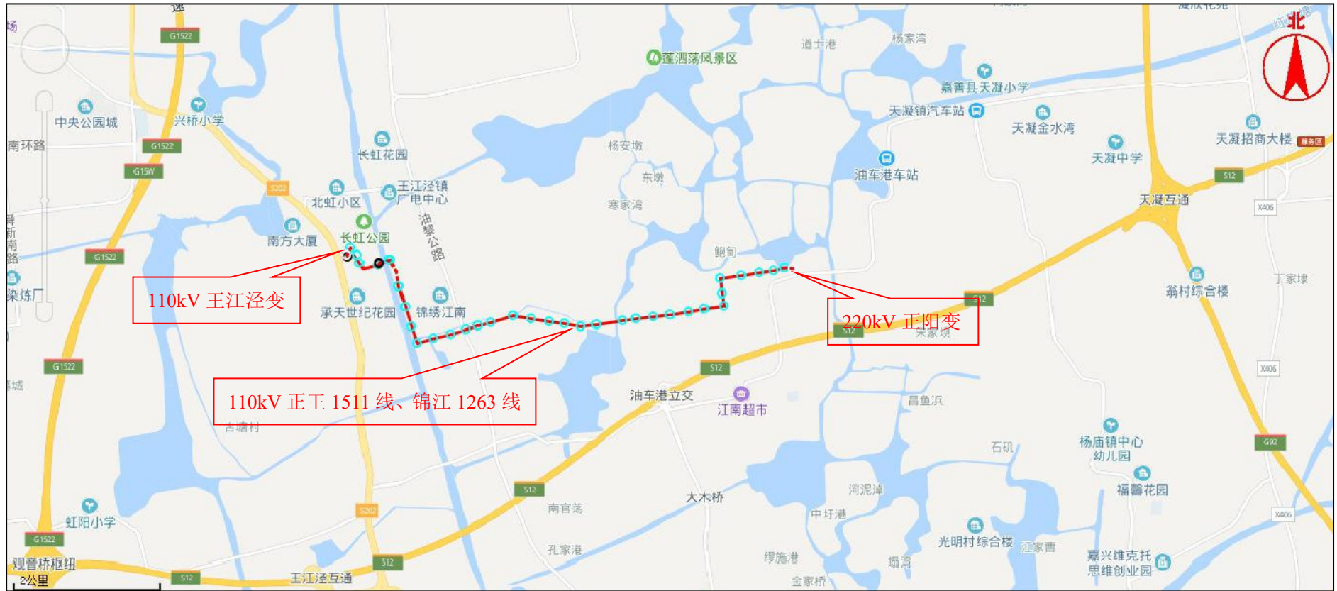
图 4-1 工程地理位置图