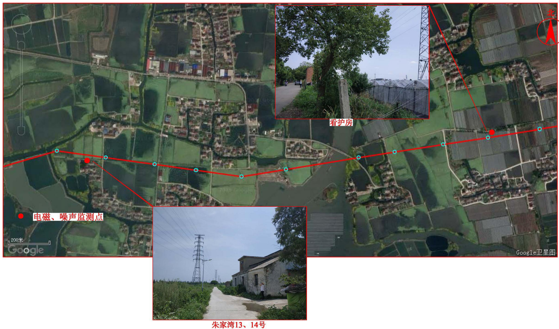
图 7-1 监测点位图 (3)