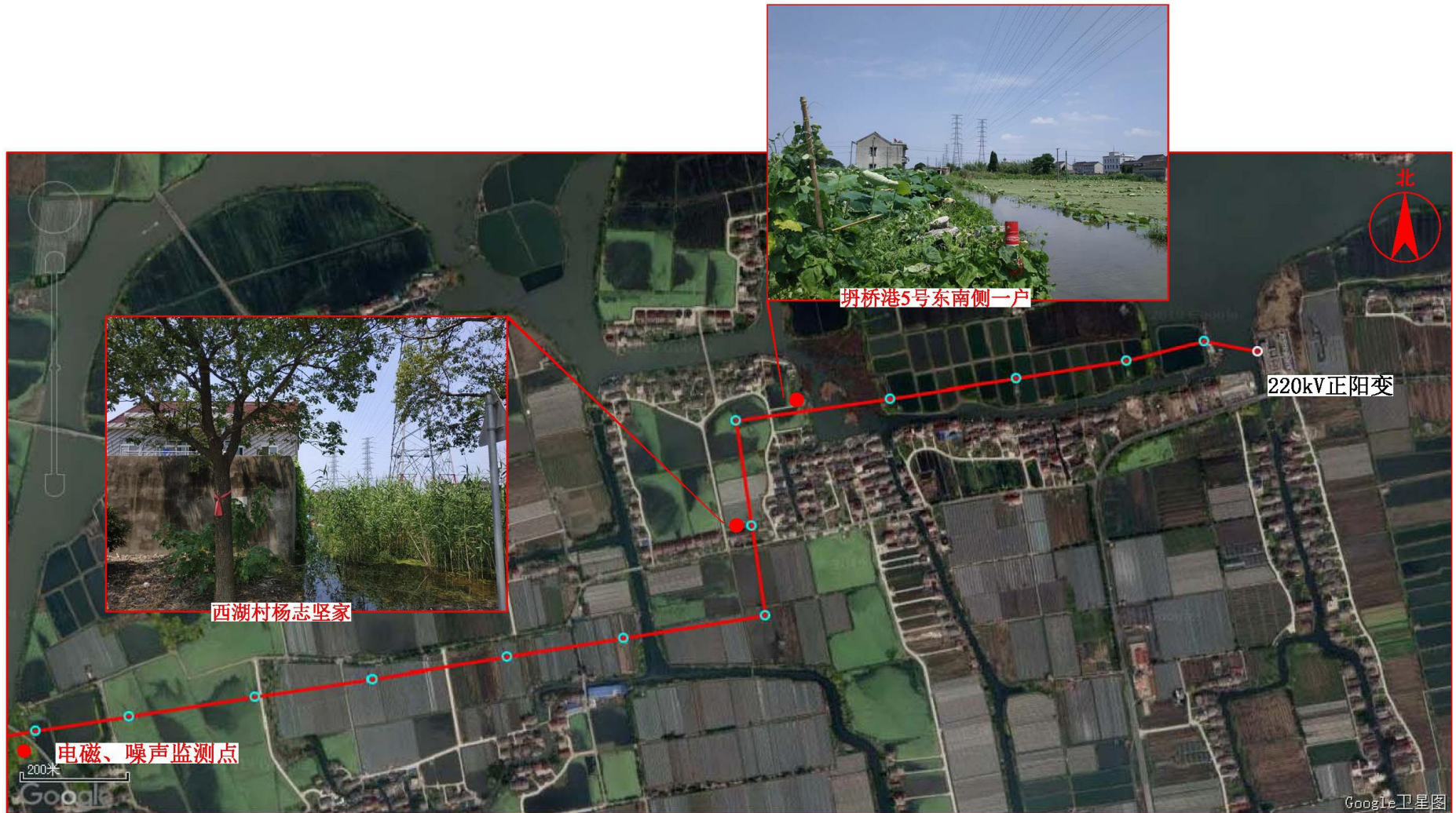
图 7-1 监测点位图 (4)