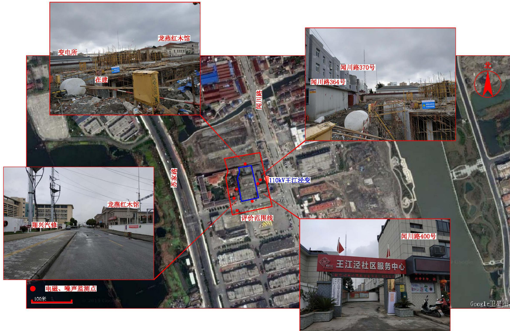
图 7-1 监测点位图 (1)