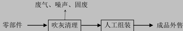
图 5-1 数码印花机生产流程及排污节点示意图